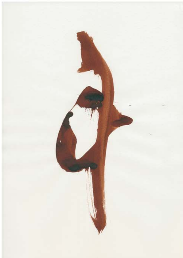
Calligraphie abstraite Nyls Willig